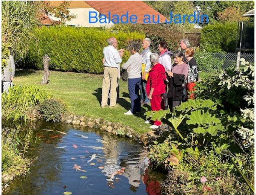
Balade au Jardin