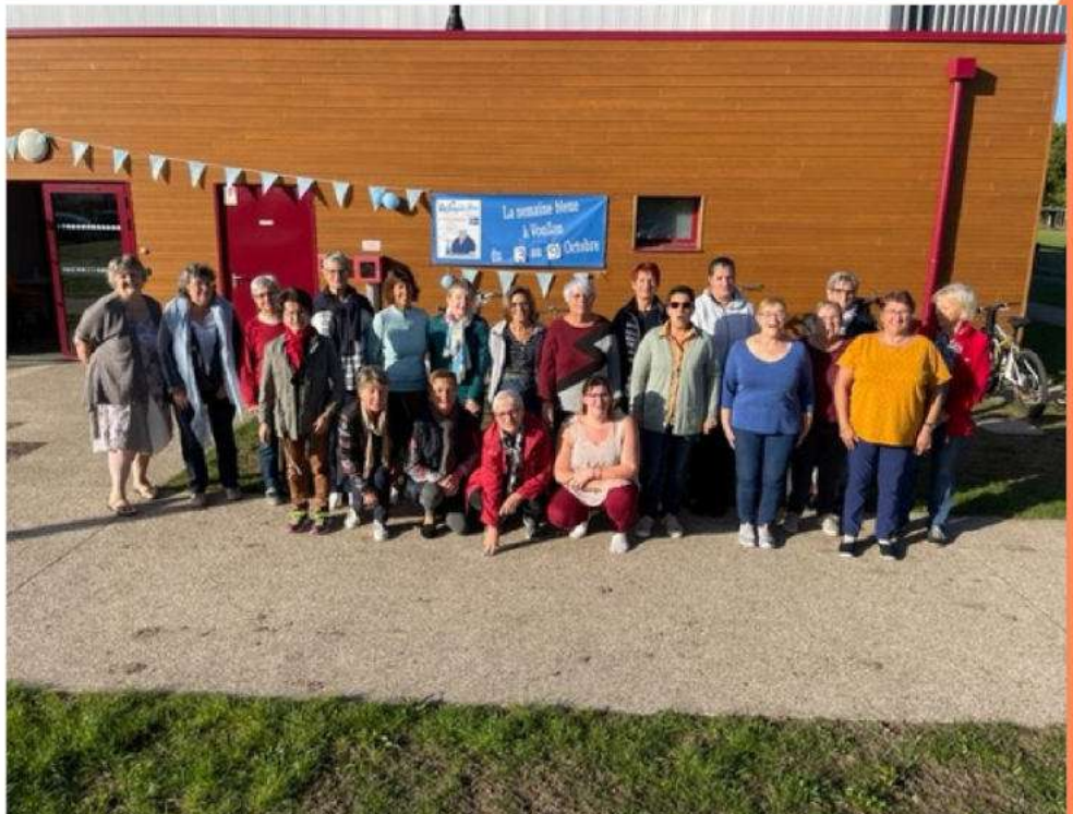
La semaine bleue à Vouzon du 3 au 9 Octobre