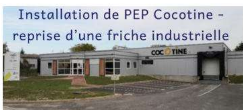
Installation de PEP Cocotine – reprise d'une friche industrielle

Création d'entreprises : SCI 2 frères Loustalot et SCI JEFF (reprise Saiter Bâtiment – création d'un nouveau local)