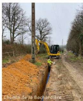
Chemin de la Bachardière