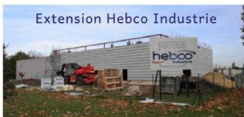
Extension Hebcos Industrie

Création d'entreprises : SCI 2 frères Loustalot et SCI JEFF (reprise Saiter Bâtiment – création d'un nouveau local)