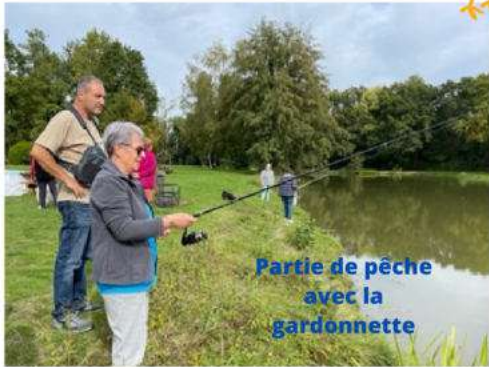
Partie de pêche avec la gardonnette

Partage sportif , avec la balade UDAF (Union Départementale des associations familiales) et ses sensibilisations, la marche nordique, le walking-foot, le tennis de table, le yoga, la danse country, la pêche, la pétanque ; Partage culturel et ludique avec la découverte du patrimoine de Vouzon, le cinéma, les contes de l'UCPS, la lecture partagée, le petit atelier créatif, la ludothèque avec la Maison des Animations ; Partage gourmand avec le goûter au jardin. Une belle semaine où chacun a pu se faire plaisir selon ses envies !