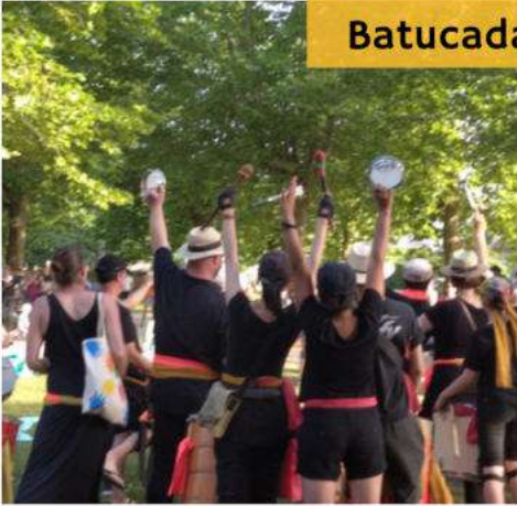
20h00 La parade de : Batucada Percussions brésiliennes