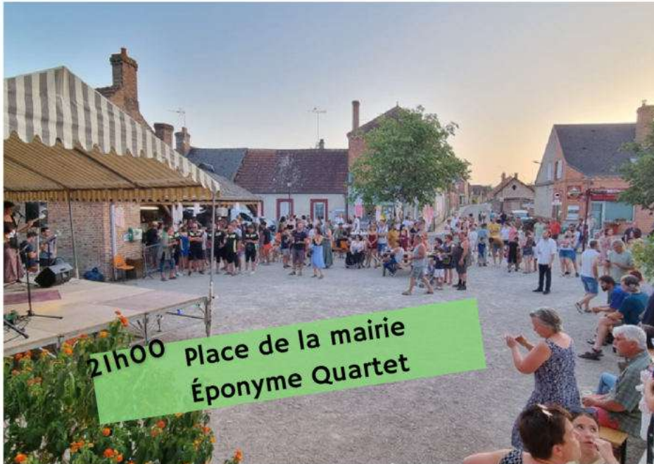
21h00 Place de la mairie Éponyme Quartet