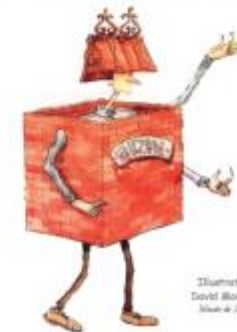
Illustration : David Worichen Maison de la Région